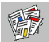
Esempi di schede

Ogni docente deciderà la dimensione ed i colori delle varie tavole dell'alfabetiere, secondo la propria organizzazione. La preparazione delle tavole può essere oggetto di un laboratorio interdisciplinare (italiano, linguaggio grafico, codici emotivi).